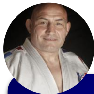
RESPONSABLES DES VETERANS