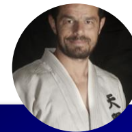
REFERENT FFSU MEMBRE DE LA CMN