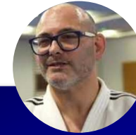
Cyril PAGES Entraîneur national en charge du secteur HP paralympique