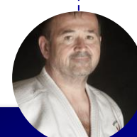
Coordination et organisation du ju-jitsu sportif