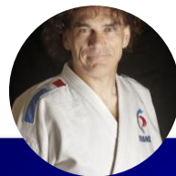
RESPONSABLE DU KATA SPORTIF