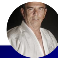
REFERENTS UNSS MEMBRES DE LA CMN